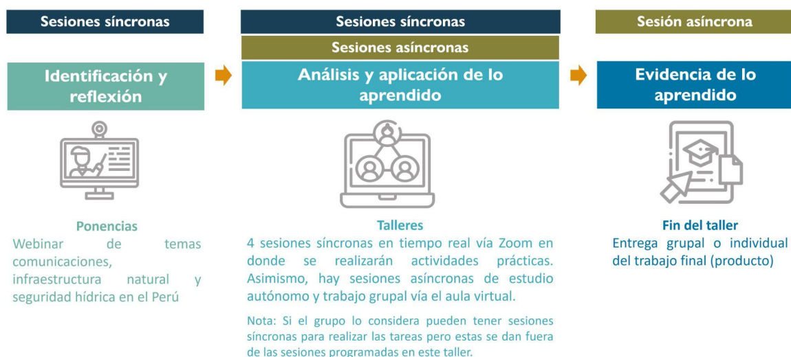
Gráfico N°2. Secuencia metodológica del taller

Es así, que la secuencia metodológica de este taller es el siguiente: